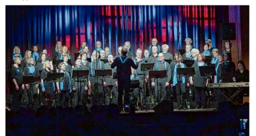
Das Chorprojekt Rosengarten gibt am Samstag ein Benefizkonzert in der Arche im Sonnenhof.

Schwäbisch Hall. Das Chorprojekt Rosengarten tritt am Samstag, 14. März, um 19.30 Uhr in der Arche im Sonnenhof auf. Unter dem Motto „Chorprojekt singt Querbeet“ präsentiert der Chor Rock, Pop, Schlager sowie Filmmelodien. Das Repertoire umfasst sowohl deutsch- als auch englischsprachige Titel. Begleitet wird der Chor von einer vierköpfigen Band. Das Konzert ist eine Kooperation mit dem Verein „MUT – Mitmachen und Teilen“. Der Erlös soll vollständig dem Verein zur Unterstützung sozialer Projekte zugutekommen, heißt es in der Ankündigung.