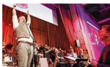
Diesmal stehen Songs aus den 80ern und 90ern auf dem Programm.

Schwäbisch Hall. Die Bigband Schwäbisch Hall ist am Samstag, 28. März, wieder in der Fassfabrik zu Gast. Das Konzert beginnt um 19 Uhr. Unter dem Motto „Time of My Life“ nimmt das Ensemble